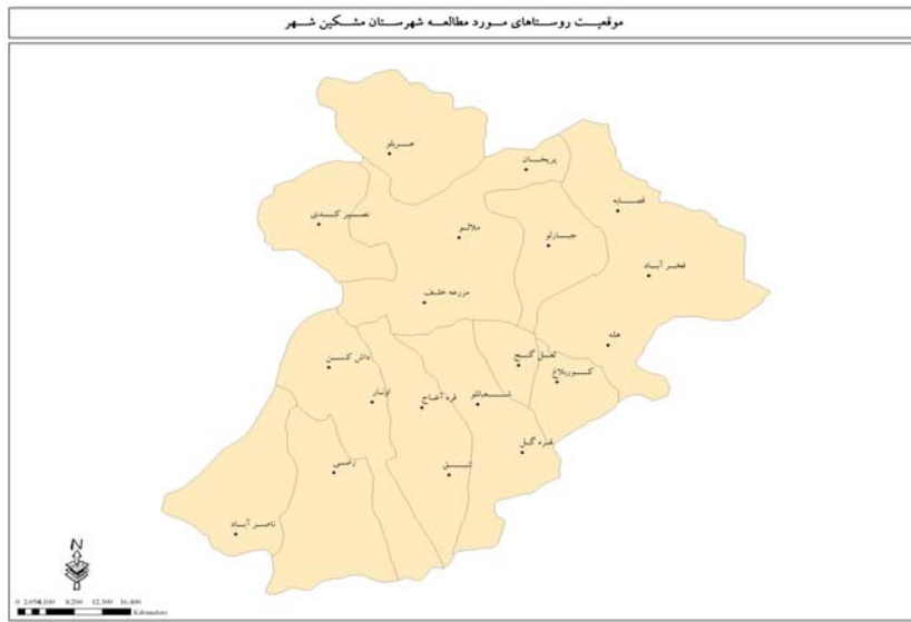
نقشه (۱) موقعیت روستاهای نمونه شهرستان مشگین شهر

روستاهای نمونه شهرستان مشگین شهر و نقشه شماره (۲) جایگاه محدوده مورد مطالعه را در سطح کشور نشان می‌دهد.