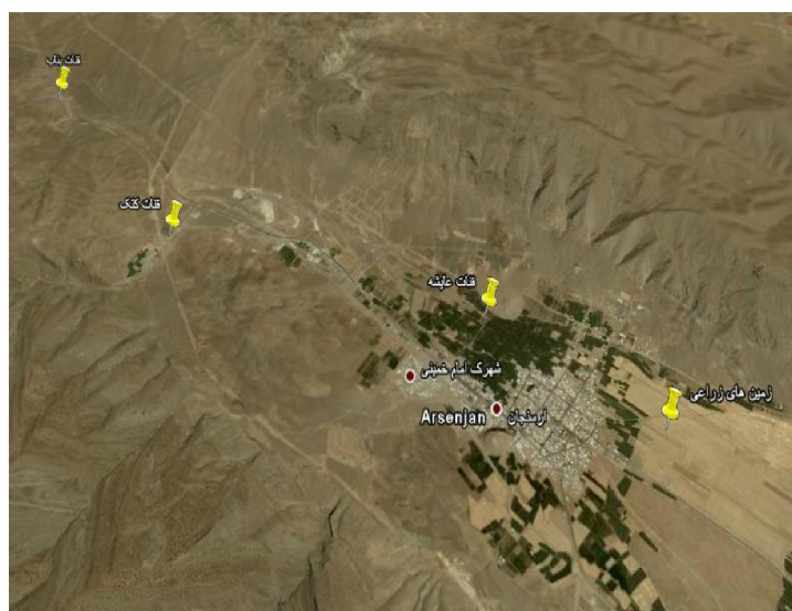
شکل ۲) تصویر ماهواره‌ای کاریزهای آرسنجان و زمین‌های زراعی تحت پوشش، (منبع: شرکت دیجیتال گلوب، سازمان زمین-شناسی ایالات متحده آمریکا، ۲۰۱۳)

نگاهی به ویژگی‌های فیزیکی و آبدهی کاریزهای آرسنجان نشان می‌دهد کاریزهای آرسنجان که گردانندگی، بهره-برداری و پخش آب آن به شیوه تعاونی و همیاری همگانی است، دارای سه رشته کاریز به نام‌های عایشه، بناب و کتک